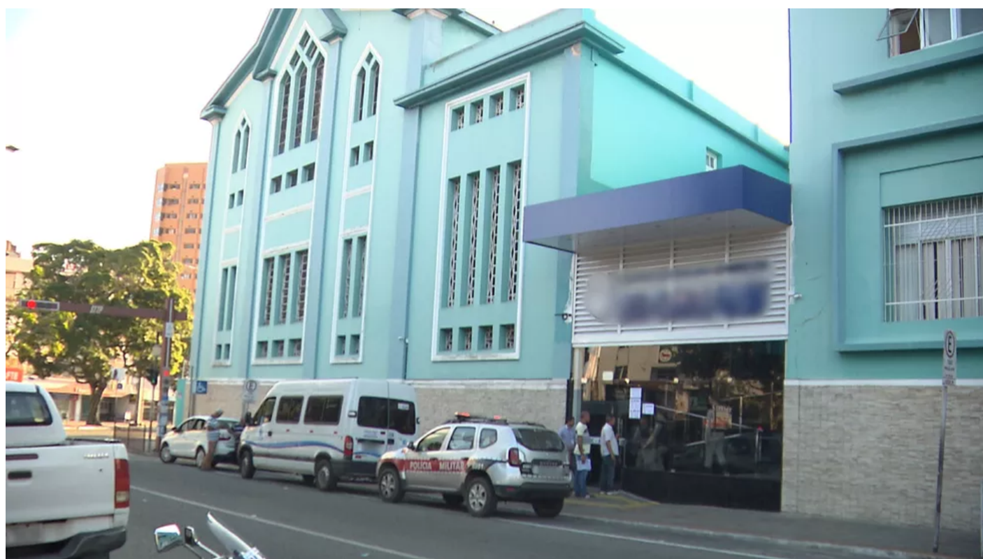
Polícia Militar foi ao colégio e levou o suspeito para a delegacia da Polícia Federal, em Campina Grande