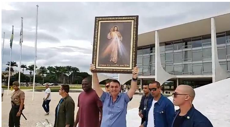
Bolsonaro levanta quadro com a imagem de Jesus Cristo